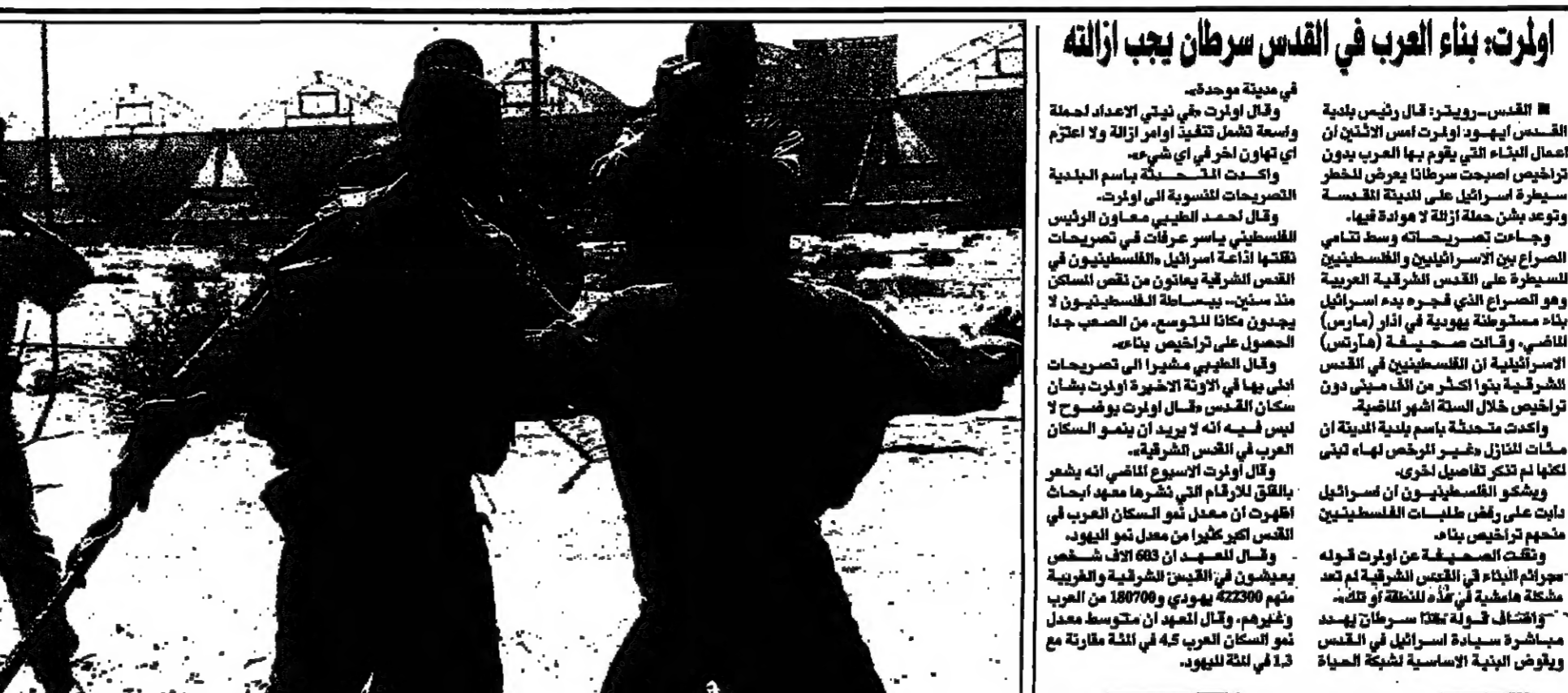
جندي اسرائيلي يحمل جرحى فلسطيني الاصابة من ارضه المصارة قرب مستوطنة ميجاز في غزة

القدس - افيدت مصادر أمنية ان اسرائيل تجري مفاوضات سرية مع دولة خليجية لاستيراد النفط. وقال مصدر عسكري ان اسرائيل تجري مفاوضات سرية مع دولة خليجية لاستيراد النفط.